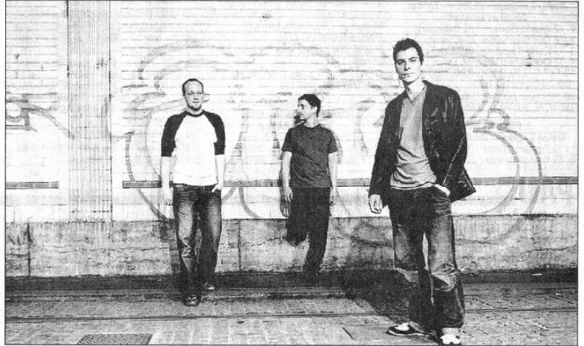
Sarro est à découvrir sur scène samedi soir à Bourg-en-Bresse

Une formule exigeante qui les pousse dans leurs derniers retranchements, quand d'autres empilent les couches de guitare pour cacher la misère. Mais la principale originalité du groupe n'est pas là. Elle réside surtout dans les vocalises complètement décomplexées de leur chanteur, nourri de Tom Yorke et de Jeff Buckley. « Au niveau vocal, je suis en quelque sorte l'an-